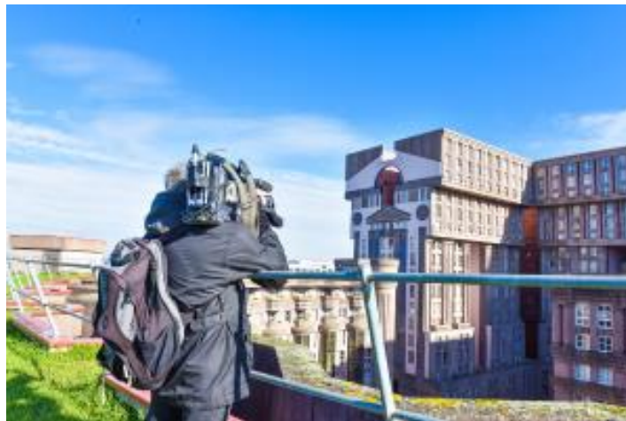
Les Espaces Abraxas

L'architecture du 20ème siècle de la ville de Noisy-le-Grand est à l'honneur avec la mise en valeur de ses lieux remarquables notamment les Espaces d'Abraxas, conçus par le célèbre architecte Ricardo Boffil et désormais connus comme lieu de tournage de nombreux films, ou les "Camemberts" de Manuel Nunez-Yanowsky.